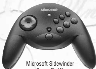
Microsoft Sidewinder Game Pad®